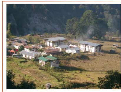
Blindenschule Khaling, Heim für blinde Mädchen etc